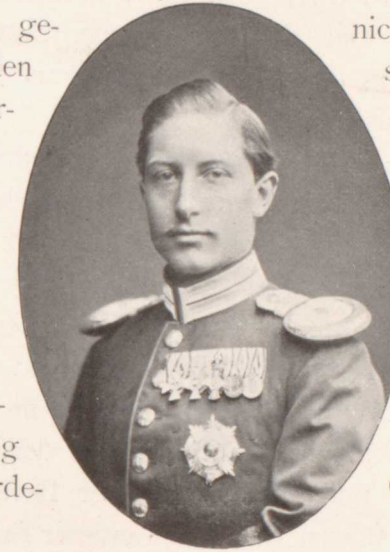
Prinz Wilhelm (1880).

Ein altes Wort, das vielleicht etwas übertreibt, sagt: „Es giebt Nichts,