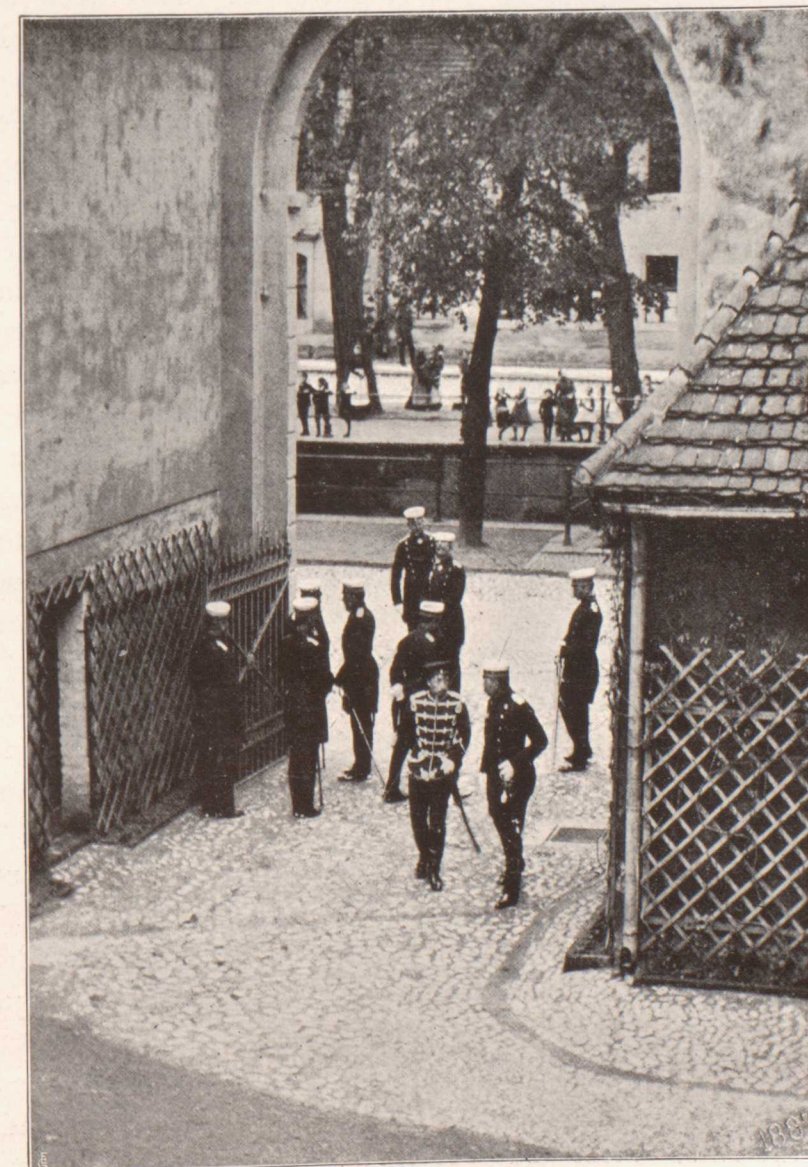
Prinz Wilhelm inspiziert die Kaserne.