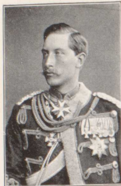
Prinz Wilhelm (1884).

Begeisterung, als wenn es gar nichts Interessanteres gäbe. — Jeder, der einmal den bunten Rock angehabt hat, weiss nun, wie unangenehm es ist, zu spät zum Dienst zu kommen — denn das ist ja so unmilitärisch, dass es dafür gar keine Entschuldigung giebt; es kann ja wohl schliesslich einmal vorkommen, aber es darf eben nicht vorkommen.