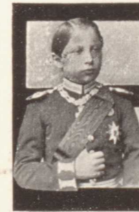
Prinz Wilhelm (1869).

Es ist ein alter Brauch und eine alte schöne Sitte, dass die Söhne unseres Herrscherhauses schon in frühester Jugend dem Heere einverleibt werden — dem Heere, dem unser schönes Vaterland in erster Linie die Machtstellung verdankt, die es in der Welt einnimmt. Vom grossen Kurfürsten an, der das erste stehende Heer schuf und das zu Anfang seiner Regierung nur dreitausend Mann zählte, bis zu unserem jetzigen Kaiser — haben alle Herrscher dem Heere ihre Aufmerksamkeit, ihre Pflege und Sorgfalt gewidmet und je nach Individualität und Veranlagung sind sie mehr oder weniger selbst „Soldaten“ gewesen.