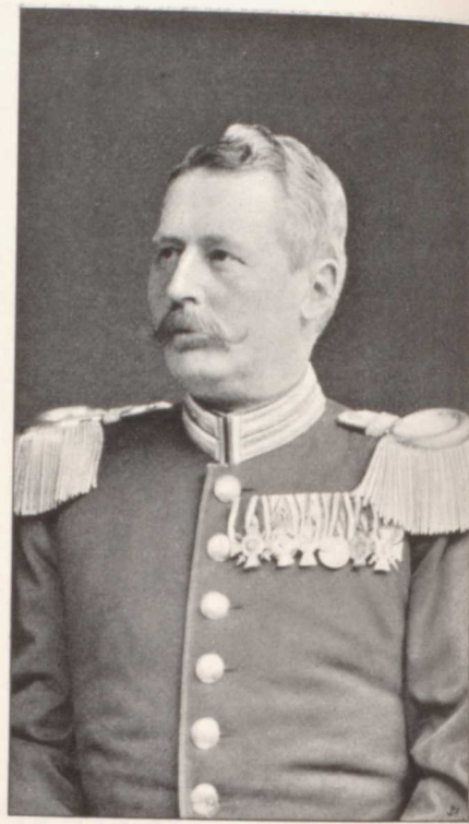
Prinz Wilhelms Kompanie-Chef (1878).

„Beim Kommiss“ sind alle gleich, der Dienst kennt keine Rücksichtnahme — da muss bei dem Parademarsch der Erbe des Deutschen Kaiserthrones ebenso gut seine Beine werfen, wie der gewöhnliche Musketier, nein, noch viel besser. Und wenn ein Prinz, der seinen Zug