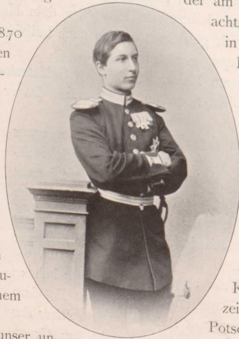
Prinz Wilhelm (1877).