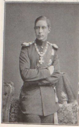
Prinz Wilhelm (1876).

Nach Beendigung der Parade, der auch der greise General von Werder mit beigewohnt hatte, versammelte der König die Offiziere des Regimentes um sich, und hielt an dieselben folgende Ansprache: