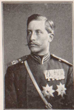
Prinz Wilhelm (1884).

Prinz Wilhelm nahm niemals Urlaub, um eine Erholungs- oder Vergnügungsreise anzutreten, seine liebste Erholung fand er am häuslichen Herde und im Kreise seiner Kameraden. Selbst Nachts suchte er einmal den letzteren auf und das soll folgendermassen zugegangen sein. War es zwischen den jungen Gatten zu irgend einer kleinen Meinungsverschiedenheit gekommen oder machte er mit seiner Gemahlin einen Scherz, kurz, er drohte ihr einmal zu später Abendstunde, dass er noch „auskneifen“ würde. Die Prinzessin lachte fröhlich auf: „Wo willst Du denn hier in Potsdam zu so später Stunde noch hin? Das ist ja ganz unmöglich!“ —