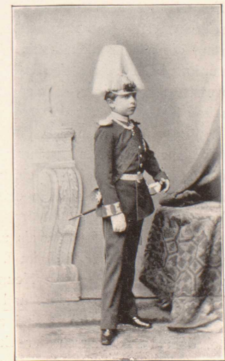
Prinz Wilhelm als Lieutenant des 1. Garderegiments.

Zum ersten Male erschien da der Prinz in Uniform, das Band des Schwarzen Adlerordens über der Brust, und der kleine Offizier schritt, die spitze Grenadiermütze auf dem Kopf, stolz, als schliessender Lieutenant des Zuges an seinem die Parade abnehmenden Grossvater vorbei.